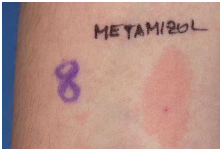
Identifizierung des Auslösers eines makulopapulösen Arzneimittelexanthems durch die 24-Stunden Ablesung eines positiven Intrakutantests auf das nichtsteroidale Antirheumatikum Metamizol (Novalgin®).

Am wichtigsten ist zunächst eine ausführliche Anamnese. Durch diese ist bereits zu entscheiden, ob es sich um eine Typ A oder B Reaktion (siehe Tab. 1 Seite 37) gehandelt hat. Nur Typ B-Reaktionen, die durch eine individuelle Disposition des Patienten bedingt sind, stellen eine Indikation zur weiteren Abklärung dar, beispielsweise keine Abklärung nach