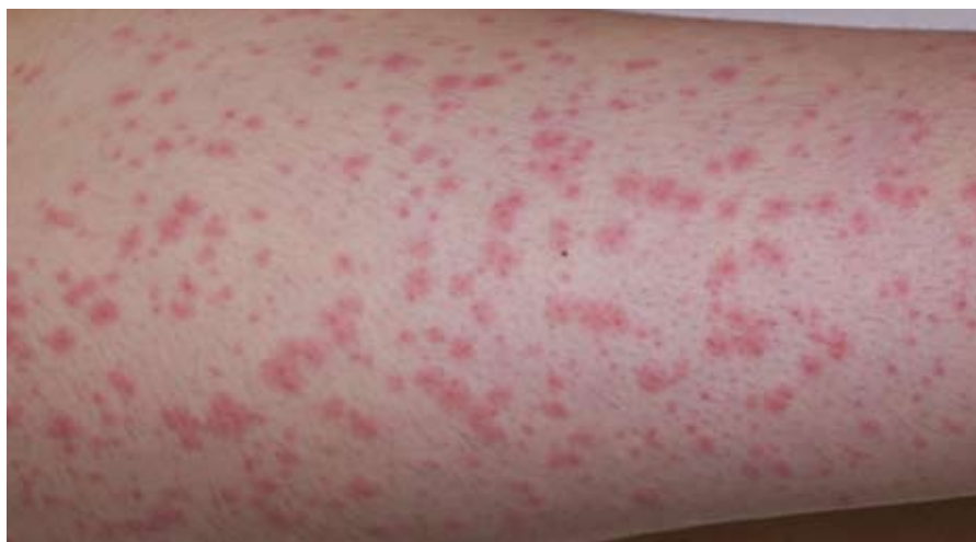
Makulopapulöses toxisches Exanthem bei Patientin mit EBV-Infektion (infektiöse Mononukleose) und gleichzeitiger Gabe von Amoxicillin/Clavulansäure (Augmentin®): klassischer „pseudoallergischer Amoxicillin rash“. Abb. 3

Das typische makulopapulöse Exanthem („Ampicillin rash“) nach Ver-